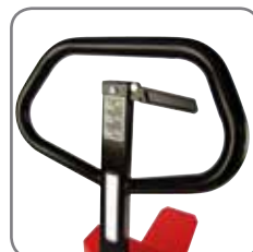
Håndtaget har ergonomisk rigtige gribevinkler, som giver brugeren et afslappet greb.