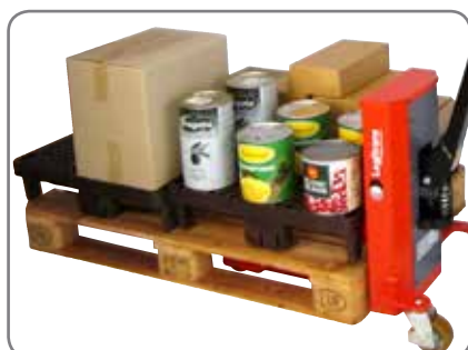
Kvartpalle løftes ned fra EUR-palle med LogiQ 300 og kan transporteres til det sted, hvor varerne skal udstilles.