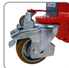
Parkeringsbremse på LogiQ 300.