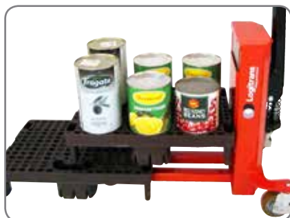
LogiQ 300 kan tage den øverste kvartpalle uden problemer.