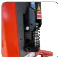
LogiQ 300 har hydraulikpumpe, som minimerer antallet af pumpeslag.