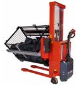
Der Rotator hat für Heben, Senken und Rotation Kabelfernbedienung als Standard. Funkfernbedienung ist für Heben, Senken und Rotation als Zubehör erhältlich.