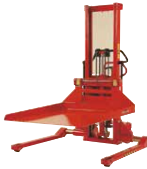
Als Zubehör werden u. a. Plattform und Kranarm angeboten.