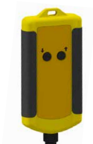
Kabelfernbedienung für Geräte mit elektrischem Hub (Heben/Senken)