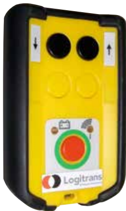
Sender für Funkfernbedienung, RCW 1, bei Fernbedienung in zwei Richtungen.