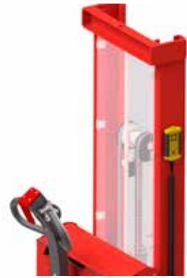
Kabelfernbedienung einfach und bequem am Gerät platzieren.