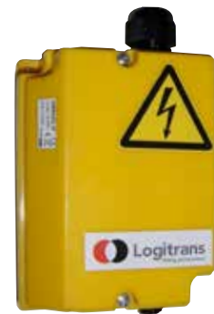
Der Empfänger für die Funkfernbedienung ist am Gerät montiert.