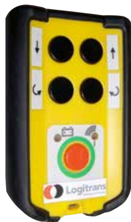
Sender für Funkfernbedienung, RCW 2, bei Fernbedienung in vier Richtungen.